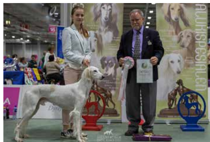
◀ Beste Bevegelser: N UCH Elsto Atif- Khariz