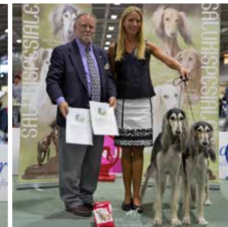
▲ Beste par: C.I.B C.I.C NORD LCCH DK SE F UCH Sadaqa Lazeez Al Alwan og C.I.B C.I B.P NORD UCH Sadaqa Laziza Bint Kifaya