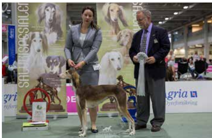
BIS brukshund: INT NORD UCH N SE LCCH C.I.B.P Caravan Bariza Badiiah Bint Bahiim ▶