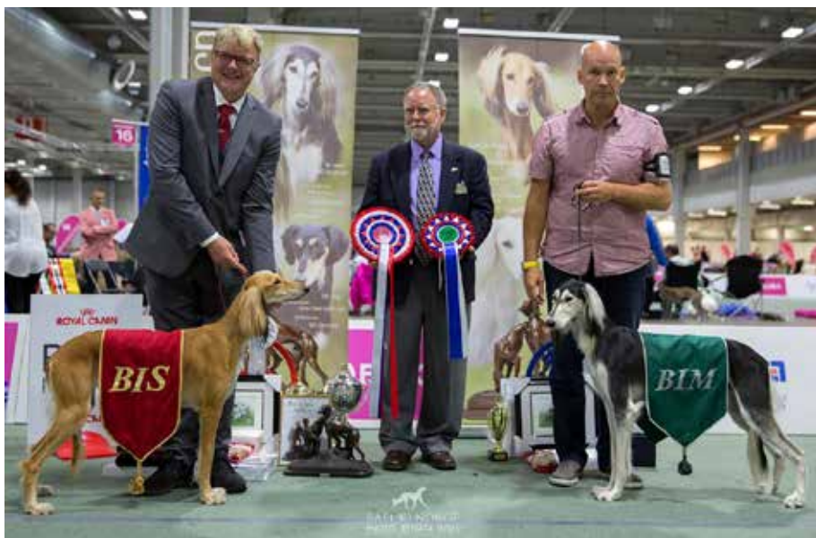
▲ BIS og BIM, cert: Sinaxs Damali og Bakalva's Special Edition