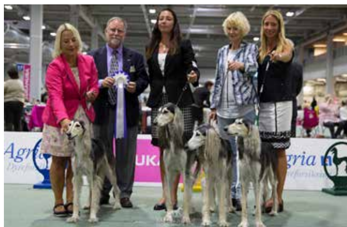
◀ BIS oppdretter: Kennel Sadaqa