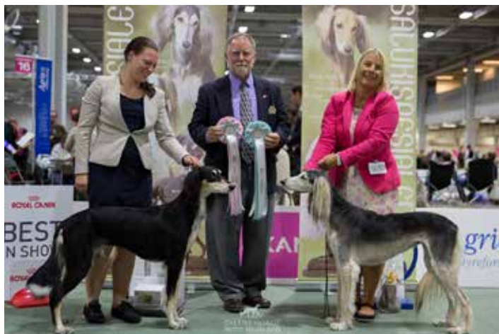
◀ BIS og BIM veteran: N DK UCH Caravan Ustura Bahiim og C.I.B NORD UCH Sadaqa Kifaya Bint Fasqiya