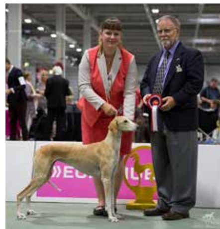
◀ Cert (BTK 3): Borgsjødalens Was It I