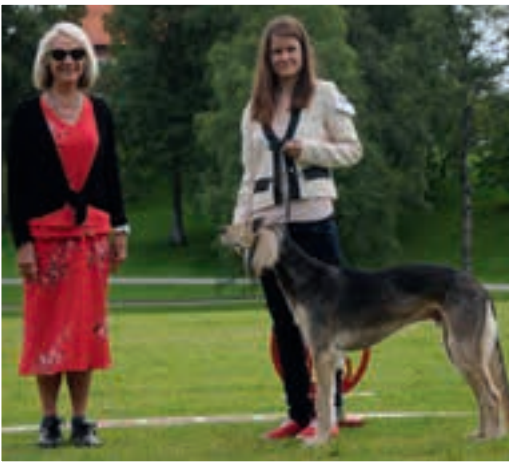
◀ BIS monorchid: Loveshack's Assisi Rosso