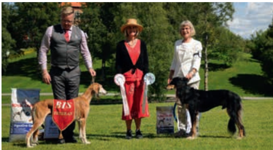
▲ BIS veteran: INT NORD UCH Courtborne Sinaxs Antilla BIM veteran: N DK UCH Caravan Brins Khamsin Ibn Bahiim