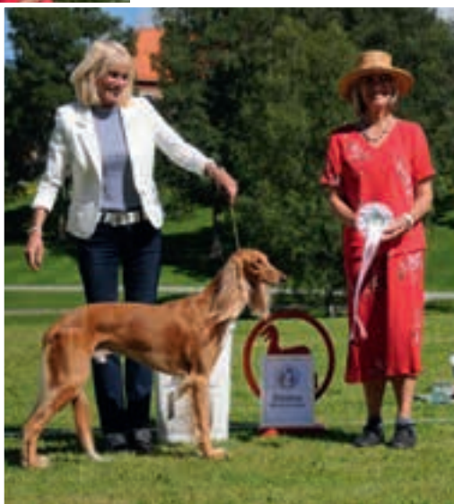
Beste bevegelser: N SE FI EE RUS CZ UCH FI JW-13 Salgrey's Dream Khan ▶