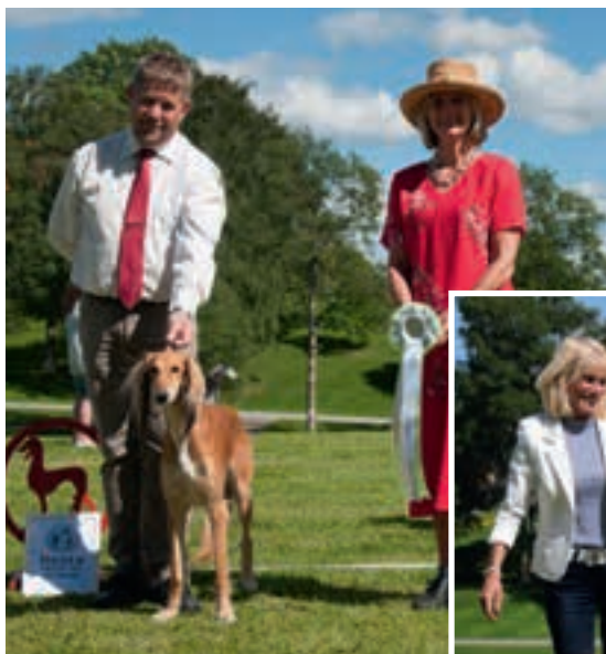
◀ Beste hode og uttrykk: N SE UCH Sinaxs Dama