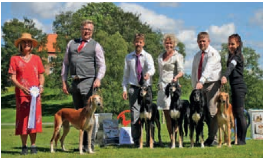
▲ Beste avelsgruppe: INT NORD UCH Courtborne Sinaxs Antilla