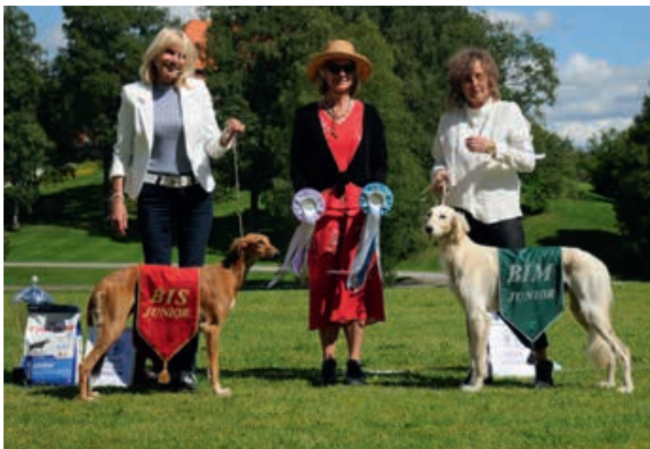
▲ BIS Junior: Qirmizi Quinelle – BIM junior: Dabka's Secret Service