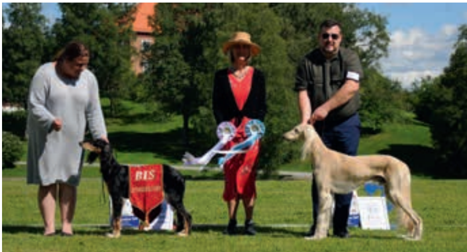
▲ BIS unghund: Dhawati Bellatrix Bint Rafiiqa – BIM unghund: SE JV-16 Mala's Amal Amir Arijan Ibn Jato