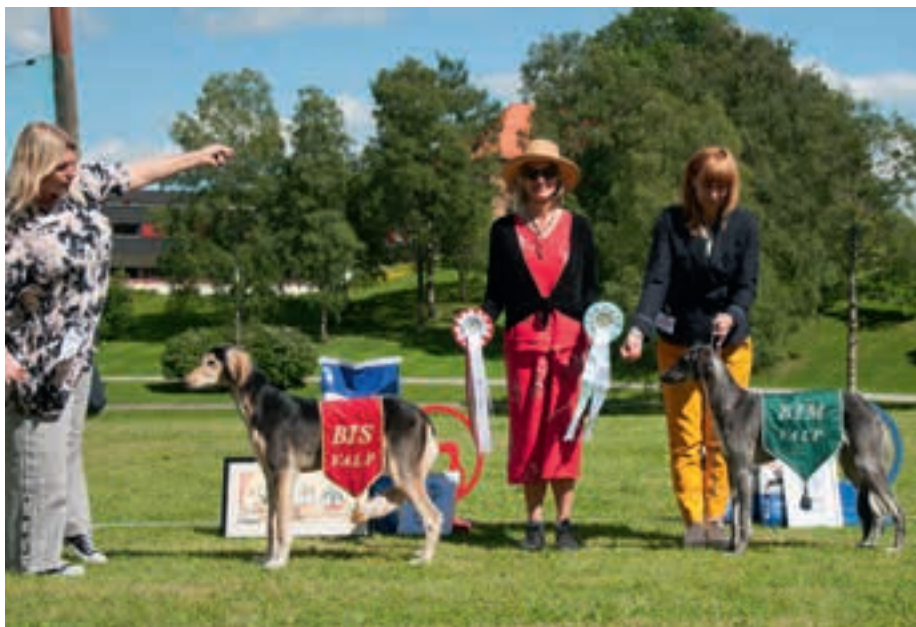
▲ BIS valp: Shamali Kahar Al Dirw Ibn Jamal – BIM valp: Davu Jumanji Lani Pegaah