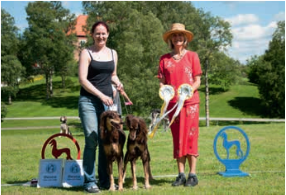
▲ Beste par: Noor Inca Bar Caramel og Noor Inca Bar Mocca