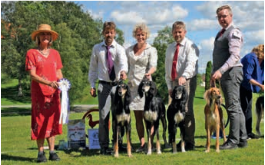
▲ Beste oppdretter: Kennel Sinaxs