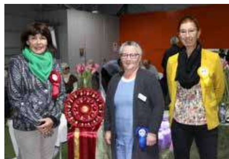
Dommer, ringsekretær og skriver.