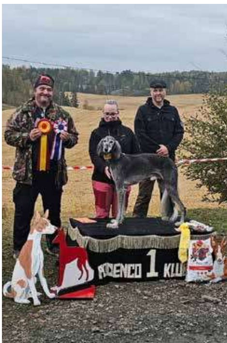
Darko i Sørum med en første plass med CERT og BIR.

I år er det hele 9 salukier som har tatt lisens og vi har blitt godt tatt imot av de mer erfarende. Det er stas at miljøet vokser og det har vært et veldig fint miljø å komme inn i. Jeg som er mest vant med utstillinger har satt stor pris på den mer avslappede stemningen på lure coursing og det å treffe hverandre i en annen setting. Jeg har blitt kjent med masse fine folk både med saluki og med andre