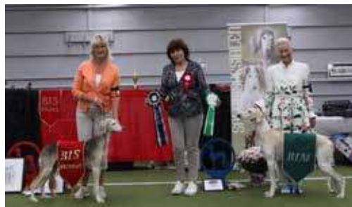
BEST IN SHOW VETERAN: Badavie Who's That Girl BIM VETERAN: Amasoneland's Peer Gynt Serenade