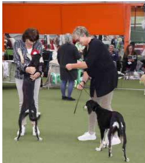
Glade valper i beste par.