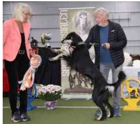
Årets LC saluki 2023 nr 3. Majo's Sakk