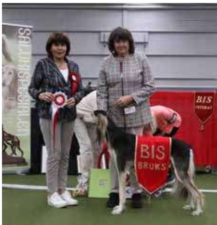
BEST IN SHOW BRUKSHUND: Hisilome's Merlin