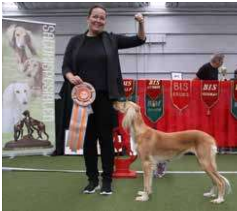
Årets LC saluki 2023 nr 1. Sommarvindens Star Light