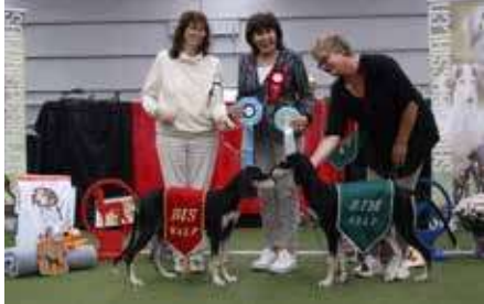
BEST IN SHOW VALP: Badavie Kind of Magic BIM VALP: Badavie Kong Kyros