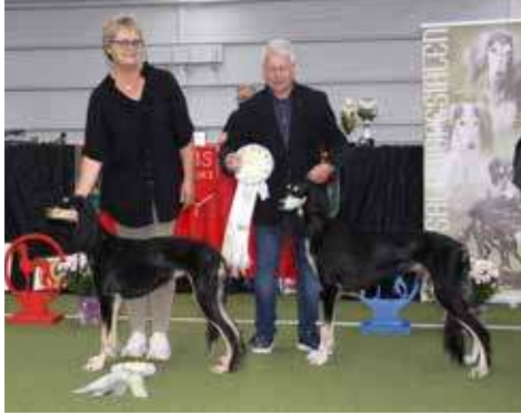
Årets utstillingsaluki 2023 nr 1 og 2. Famerelle Aranel & Ta'zim Khaziin