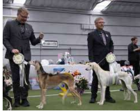
Årets utstillingsaluki 2023 nr 3 og 5. Ta'zim Kalilah Sinaxs & Sinaxs Elmira